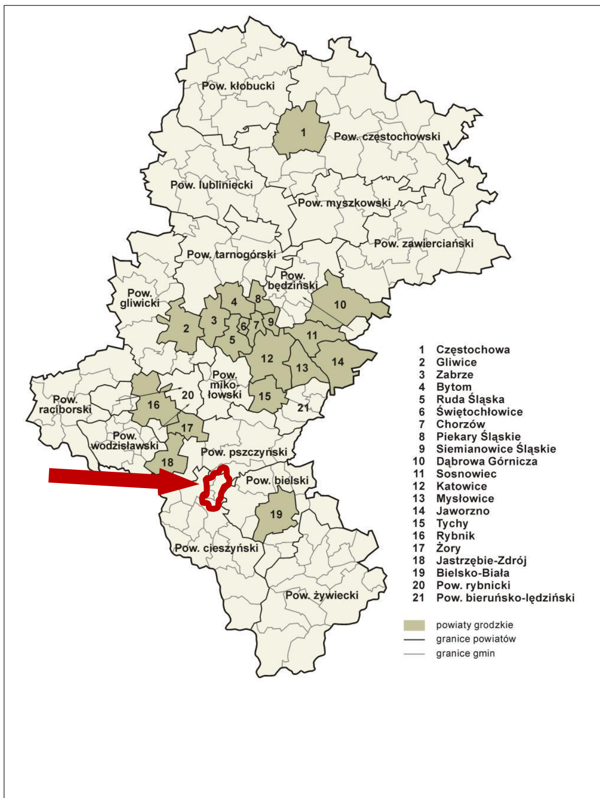
Mapa 2: Lokalizacja Gminy Chybie w skali województwa śląskiego