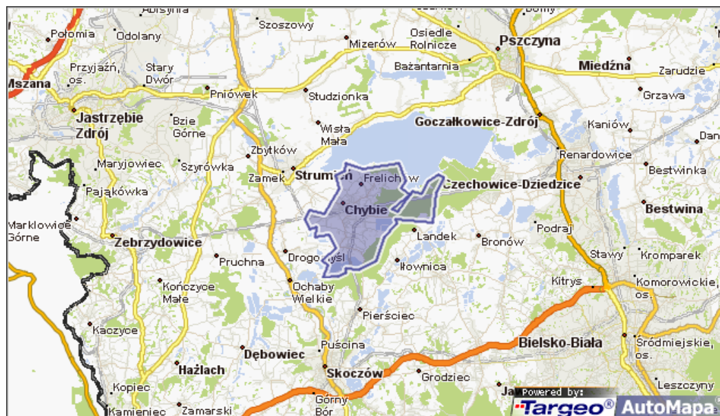
Mapa 1: Lokalizacja Gminy Chybie w jej najbliższym otoczeniu

Lokalizację Gminy Chybie zaprezentowano na poniższych mapach: